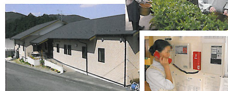
錦苑と連動して非常事態における対応も徹底しています。

認知症高齢者の方が少人数の家庭的な環境のもと、スタッフのサポートを受けながら共同生活を送っていただけます。